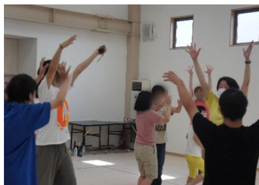
コンテンポラリーダンス