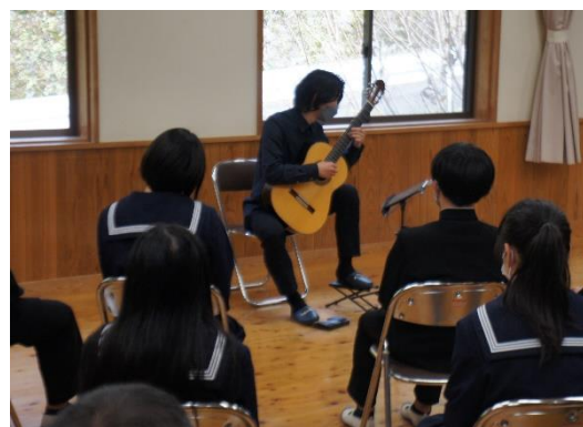
クラシックギター