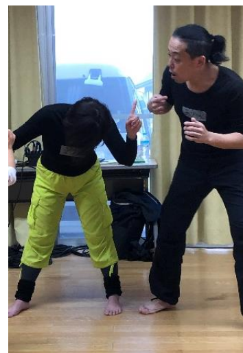
コンテンポラリーダンス