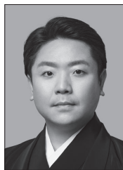
いちかわせいこ 市川青虎