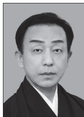
かみむらきちや 上村吉弥