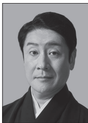
いちかわえみさぶろう 市川笑三郎