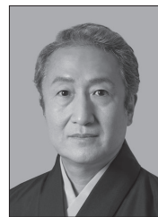
なかむらきんのすけ 中村錦之助